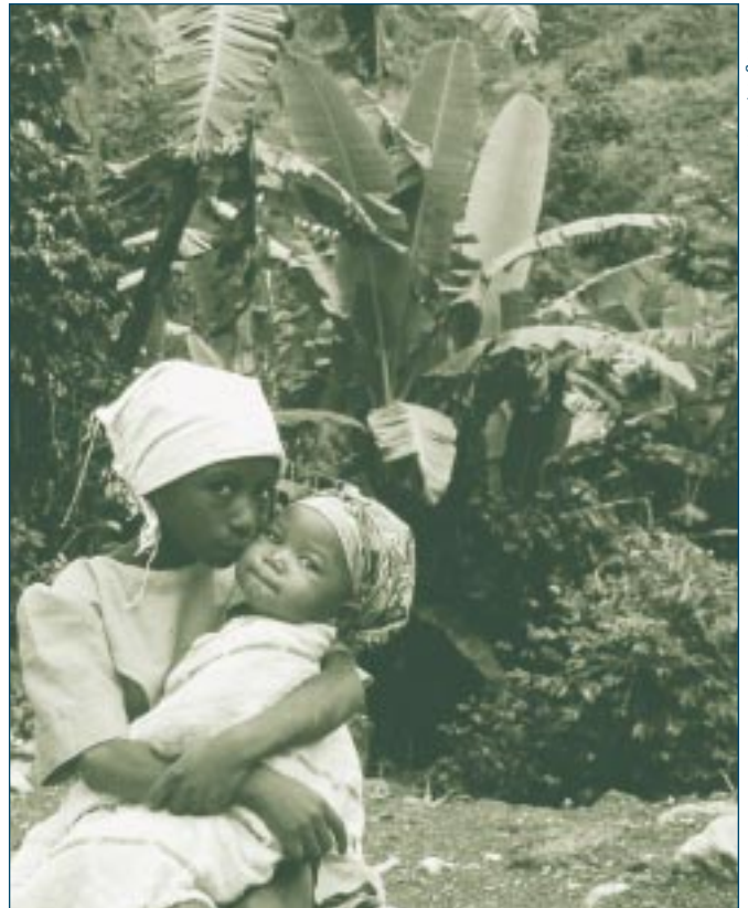
En 1983, Pic Macaya, le pic montagneux le plus haut d'Haïti, situé dans le sud-ouest de la péninsule, a été déclaré parc national Pic Macaya par le gouvernement haïtien. Dix ans plus tard, l'USAID/Haïti a demandé au BSP de l'aider à protéger le parc de la dégradation et de l'empiètement. Le BSP a travaillé avec l'UNICORS et le CFET afin de promouvoir des pratiques de gestion durable dans le parc.

Somé du CARPE met, lui aussi, l'accent sur la nécessité pour les alliances d'être flexibles — non seulement dans des zones de guerre et de conflit en mutation constante, mais également en temps de paix. "Il faut s'adapter aux changements survenus dans le projet en raison des conflits qui vous entourent," explique-t-il, "mais il faut aussi se préparer au processus de paix — en faire partie et tirer profit des occasions offertes par la nouvelle politique."