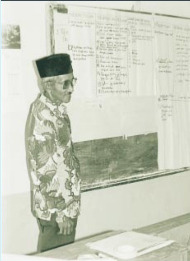
LATIN (Indonesian Tropical Institute)

Dans un atelier destiné à discuter de l'établissement de "systèmes d'informations aux villages" dans le parc national Ujung Kulon, ouest de Java, un partenaire du KEMALA encourage les participants à expliquer les résultats des discussions de petits groupes à un groupe plus important. Des fiches individuelles sont utilisées pour noter les questions à propos desquelles les villageois souhaiteraient obtenir plus d'informations des "systèmes d'informations aux villages." Les fiches sont réparties en deux groupes: celles qui concernent les questions liées au parc national Ujung Kulon, et les autres.